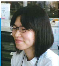
監修 管理栄養士副主任 加納 まどか